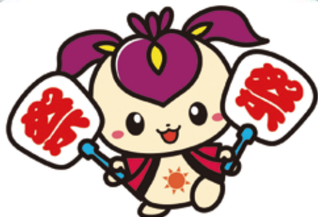
旭区マスコットキャラクター “しょうぶちゃん”