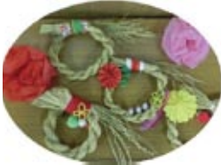
11/26 わら縄のリース作り