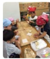
「わくわく子どもキッチン」PR ミニピザ