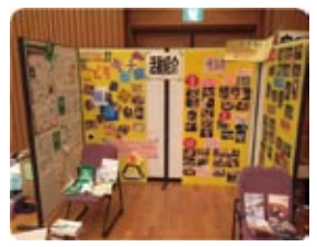
活動紹介 & 1000ピース 夢の白地図プロジェクト (千林商店街 同時開催)