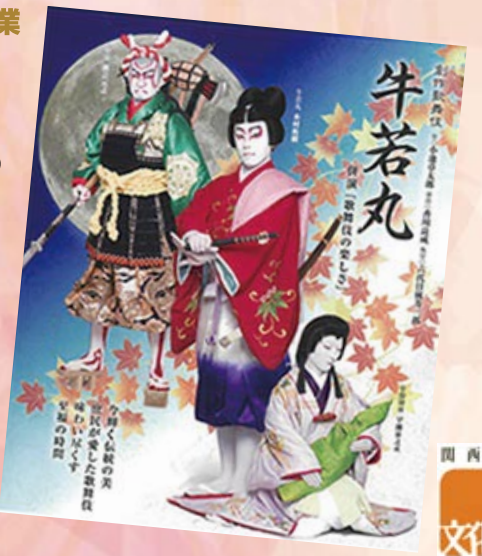
関西元氣文化圏参加事業

「雪月花」の三幕で携成された舞台には、衣裳・舞台装置など色鮮やかな世界が広がります。そして、女形、舞踊、立廻りと、歌舞伎の魅力がたっぷり！花道を使った本格歌舞伎。出演者による解説があり、幼児から楽しめます。