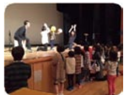
フットバッグ パフォーマンス LifeUnder(eN)