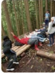
森の中は手作りの遊具がいっぱい!