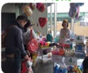
Happy Smile 37 パレオンくじ引き