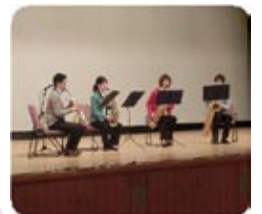
サクソス四重奏 コスモスサクソス アンサンブル