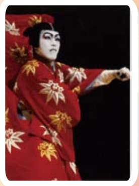
花王スマイルチャレンジ「印象」 ～限取で変わる印象～

「雪月花」の三幕で携成された舞台には、衣裳・舞台装置など色鮮やかな世界が広がります。そして、女形、舞踊、立廻りと、歌舞伎の魅力がたっぷり！花道を使った本格歌舞伎。出演者による解説があり、幼児から楽しめます。