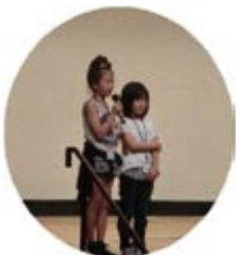
小学生の舞台 あいさつからスタート