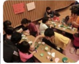
工作 (紙コプター&クリスマスツリー)