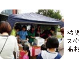
幼児のママチームの焼きそば スペシャルソースが子どもに人気！ 高校生のたこせん完売！