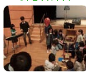
ピタゴラススイッチ