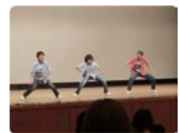
ダンス 「ベースロッカーズ」 「桜つ娘(さくらっこ)」 from [ESSE]