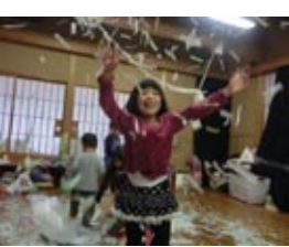
季節の先取り? 紙の雪合戦