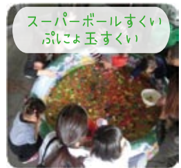
スーパーボールすくい ぷいよ玉すくい