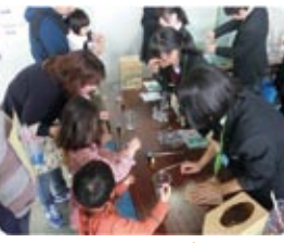
スライム作り (常翔学園高等学校 科学部)