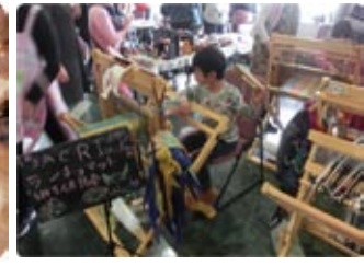
SAORI 豊崎長屋 さをり織り