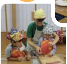
かぼちゃの春巻き作り