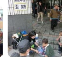
温 (おん) おもちゃの金魚すくい