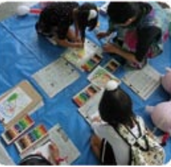
表現を楽しむ美術の教室 atelier タッチ お絵描きワークショップ

*様々な体験が1つのエリアでできて楽しむと同時に、子どもの表情がイキイキとしていたので良かったです。 *スライムコーナー・紙コプター、的あて(特にここは小学生のおねえちゃんが上手に教えてくれました) みんな教えてくれる人が優しくていいでした。 *なんとなく来場しましたが、とても楽しめました。ダンスは子どもも大喜びで本当にすばしかったです。 *とても楽しかった。安かったのいろいろな事ができました。 *カフェなど大人向けの出店もあり楽しめた。 *食べ物がおいしかった。 *いろいろな店があって楽しかった。 *化学的なこともできて楽しかった。 *来年ものござりで何かしたいです。 *手作りの品物を見に来ました。舞台のダンスが迫力あって見入ってしまいました。 *楽しかったです。今後も続けていただき子供との交流を含め、住みよい平和な旭区を作って下さい。