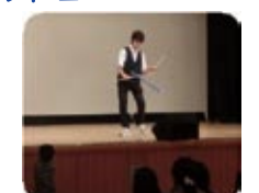
ジャuggling 大阪工業大学 ジャugglingクラブ TOSS