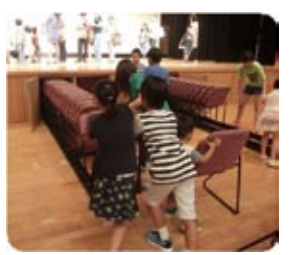
片づけもバッチリの子ども達

とてもおもしろくて楽しかったです。絵本ライブに来るのは2回目ですが前回も今回もメッチャ笑いました。歌もおもしろくて優しい感じがしました。また来ます!