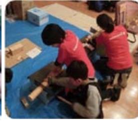
いのこうのクラブ 木工(えんぴつ立て)