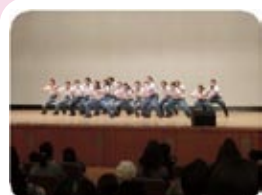
ダンス TDC27 鶴見商業 高等学校 ダンス部