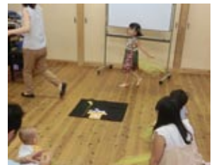
助成：大阪市ボランティア活動振興基金

今月のテーマは「お月見」ということで、お月様に飾る「すすき」を探しに行きます。途中でどうさんやりすさんに会って、身振り表現をしたりこおろぎをつかまえたり、季節を感じてもらいました。こおろぎつかみは、1匹ずつゆっくりつかまえる子や必死に何匹もつかまえる子もいて楽しんでくれました。最後にうさぎさんに出会うと「すすき」の場所までうさぎとびでピョンピョンしながら連れて行って、お月見団子も作ります。ぺったんぺったんタンバリンを順番にたたいておもちゃつきをして、ママとからだをこねこねのびのび丸めてふれ合いながら、まんまるにできたお団子を三方に飾りお月様が見える場所に飾りました。♪でたでた つきが~♪とうたうと、子ども達も大きな声で一緒に歌ってくれました。キレイなお月様をみつけたときに、今日のリラミックを思い出してくれたらうれしいです。(土曜日担当いちゃん先生) -6-