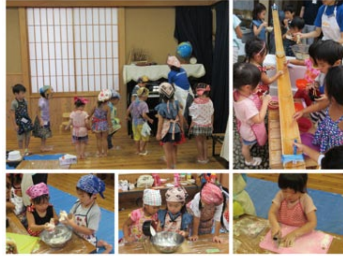
8/27 (日) うどんづくり&流しうどん