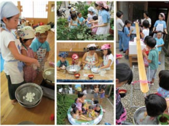
7/23 (日) 夏野菜の収穫&流しそうめん