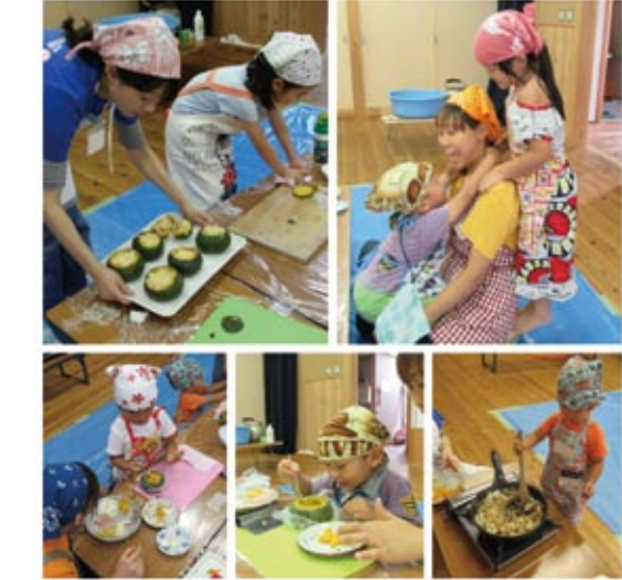
9/3 (日) 食べられる器シリーズ「かぼちゃグラタン」

今回は、年長さんにそれぞれのチームのリーダーになってもらいました。年上ということ意識して、年下を引っ張っていく役割をわかってもらうためです。人数も多く、器具を使ったり材料を入れるときに順番待ちをすることもりましたが、じゃんけんしたり、年上の子が譲ってくれたりできていました。生地をこね、袋に入れて足で踏む工程では、ピアノのメロディーに合わせて、みんな一生懸命足踏みをしていて、その姿がとても可愛かったです。いよいよ生地をのばして切るときは、年長さんが上手に薄くのばして、誇らしげにみんなに見せてくれて頼もしかったです。小さい子たちも、お兄ちゃんお姉ちゃんが上手にやっているのを見て、がんばっていました。太さも長さもバラバラなうどんになりましたが、無事に流しうどんができて本当に良かったです。素敵な夏の思い出ができました。今後も苦手なことは補い合って、できることを増やしてみんなで楽しく成長できるキッチンを目指したいです。年長さんの先生キッチンにも期待です♪ (ぱっぴー ユース/大学4年生)