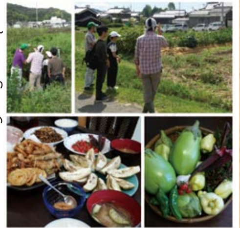
有機農園「ばんごんじんじい」(姫路市)さんにご協力いただき、ユース向けの農業体験交流会などを計画。