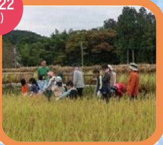
泥にまみれて米づくり