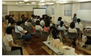
会場を提供いただいた株式会社ナプラス様ご協力ありがとうございました。