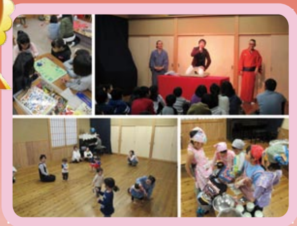
子どもセンターにあつまれ～！