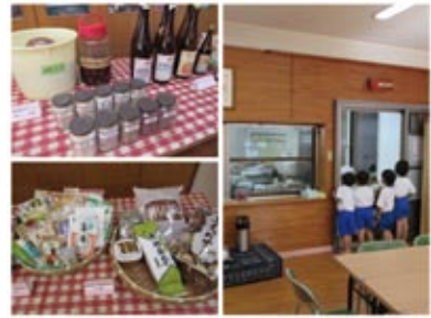
食材は、無・減農薬の有機栽培の玄米、旬の野菜、調味料は無添加・自然醸造のもの。

「食育」という概念がなかった40年以上前から、玄米とみそ汁、納豆、季節の野菜という給食を実践する福岡県の 高取保育園 が舞台のドキュメンタリー。園児たちは、みそづくりや、漬物・梅干づくり、食事の用意などを通じて「食がいのちを作ること」を学んでいます。