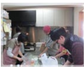
風食づくりなどしながら、子育ての話などわきあいあい。

生きていくために、勇気と知恵を！ 「考えよ！決めるのは君だ！」 ＜人形劇団むすび座について＞ 東海地方で初のプロの人形劇団として誕生。今年設立50周年を迎えた老舗の人形劇団。年間約1,200回上演し、約18万人の観客動員を誇る。