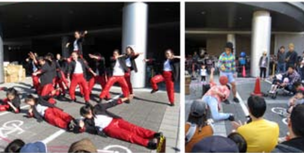
<パフォーマンス> ○大阪市立鶴見商業高等学校ダンス部 [ダンス] Ocharhan [フットバックパフォーマンス]