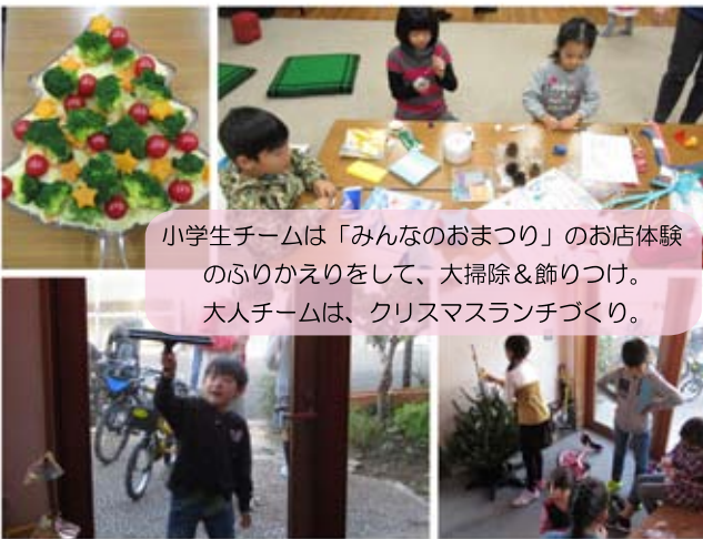
小学生チームは「みんなのおまつり」のお店体験のふりかえりをして、大掃除&飾りつけ。大人チームは、クリスマスランチづくり。