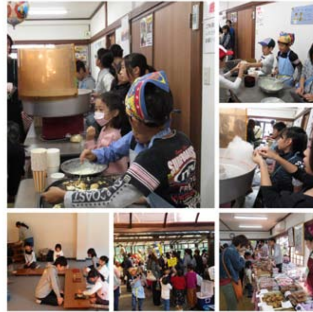
小学生チームは、自分達で考え準備してきた“わたがし”“ベビーカステラ”やさんがんばりました。