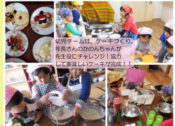
幼児チームは、ケーキづくり。年長さんのかのかんちゃん先生役にチャレンジ！協力して美味しいケーキが完成!!