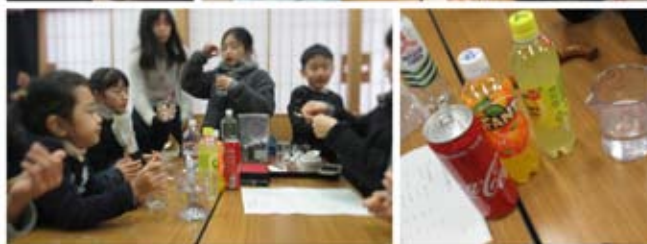
↑午前中：実験 ↓午後：ボードゲーム屋さんに行き、みんなで遊べるゲームを選び、おまつりの自分達のお店の売り上げで購入！