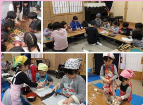
寺子屋&わくわく子どもキッチン