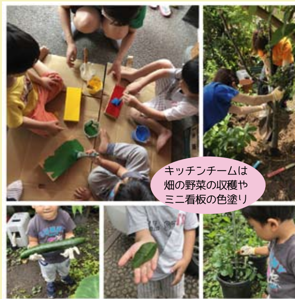
キッチンチームは畑の野菜の収穫やミニ看板の色塗り

6・7月の2回の行事(合同)で、子どもセンターの入り口の扉のペンキぬりや掲示板のリニューアルが完成しました! 掲示板には、寺子屋チームのメンバーが描きたいものをミックス。<富士山>や<バルーン><女の子のキャラクター>など。バラバラや〜ん! なイラストたちが、なんといい感じに融合し、みんな大満足。途中、今日で仕上がるのかなあとおりましたが、すごい集中力! やりたいことは、ケンカしながらも協力あって、やりきるところはさすがです。雨予報も吹き飛ばすぐらい、子どもたちの「やりたい!」「やってみよう!」のパワーは偉大です。ステキな子どもセンターの目印ができました。遊びに来てね!