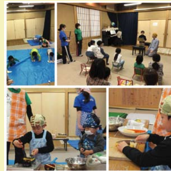
年長児は<先生役>にチャレンジして卒業し、寺子屋チームに移行。

6・7月の2回の行事(合同)で、子どもセンターの入り口の扉のペンキぬりや掲示板のリニューアルが完成しました! 掲示板には、寺子屋チームのメンバーが描きたいものをミックス。<富士山>や<バルーン><女の子のキャラクター>など。バラバラや〜ん! なイラストたちが、なんといい感じに融合し、みんな大満足。途中、今日で仕上がるのかなあとおりましたが、すごい集中力! やりたいことは、ケンカしながらも協力あって、やりきるところはさすがです。雨予報も吹き飛ばすぐらい、子どもたちの「やりたい!」「やってみよう!」のパワーは偉大です。ステキな子どもセンターの目印ができました。遊びに来てね!